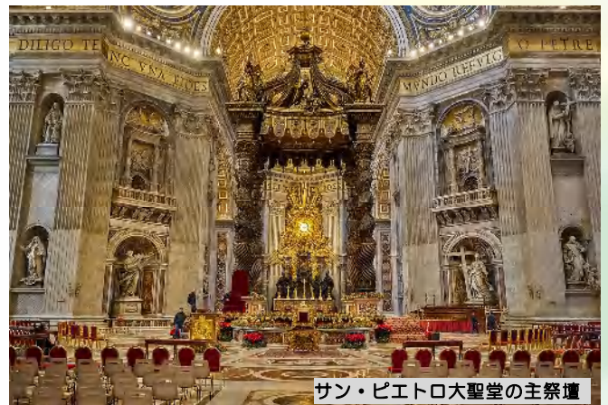
サン・ピエトロ大聖堂の主祭壇

サン・ピエトロ大聖堂は、バチカン市国の玄関口であるサン・ピエトロ広場の西側に面して建つキリスト教最大の建造物です。建設工事は1世紀以上の長期にわたり、設計や監修にはブラマンテ、ラファエロ、ミケランジェロなど、時代の寵児と言われる天才芸術家が10人以上が携わり、内部はルネサンスとバロック芸術の粋を極めた絢爛豪華な巨大空間となっています。